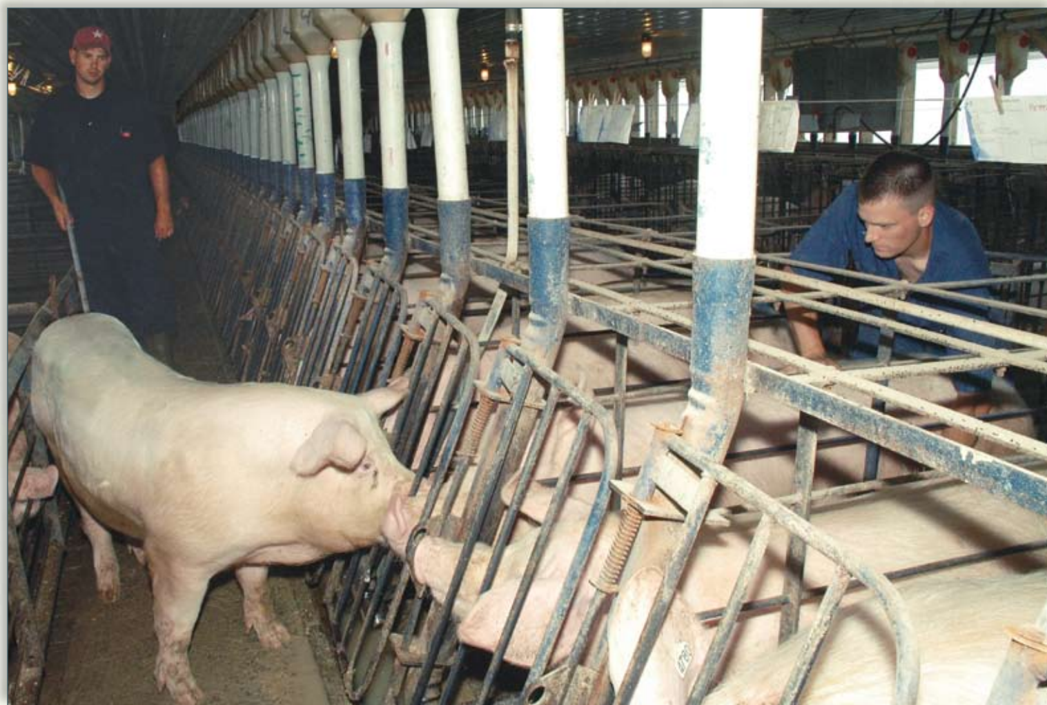
La detección de estros o calores exitosa es vital para identificar acertadamente el comienzo del estro. La detección de estros efectiva requiere exposición controlada al semental, técnicos capaces de estimular el estro en presencia del semental y el registro efectivo de los calores.