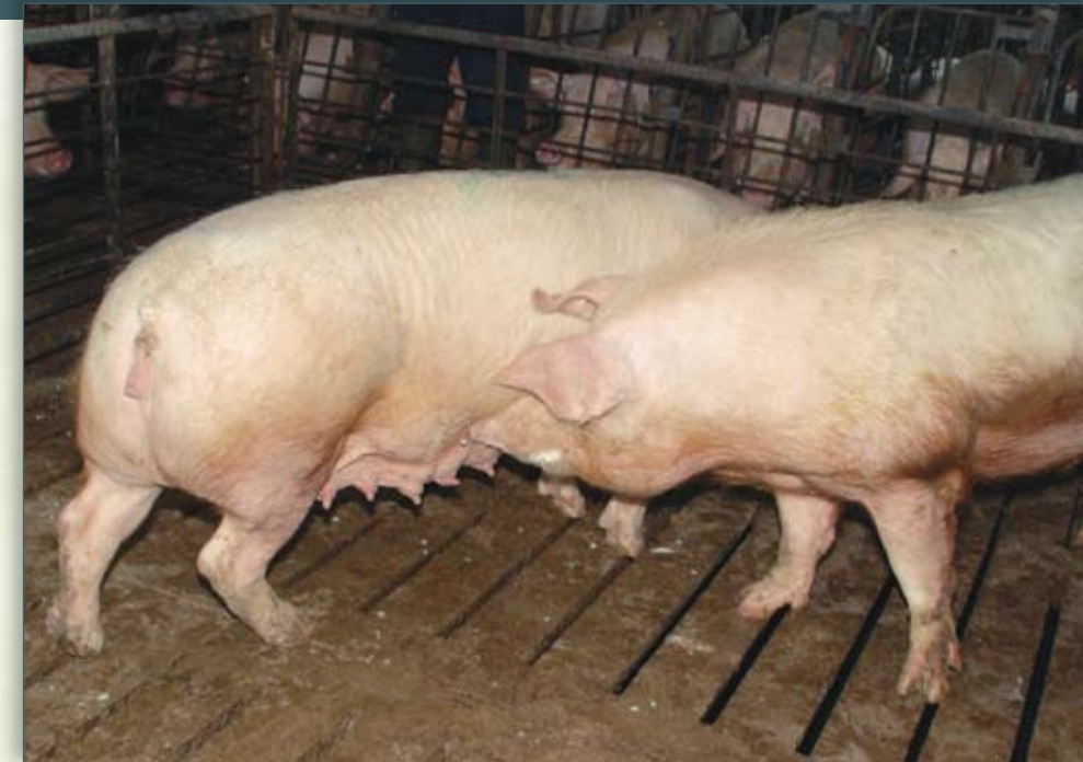
El semental trompea el lado y flanco de la hembra para provocar el reflejo de inmovilidad.