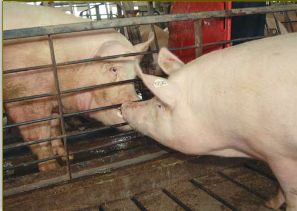
Controle la exposición de la hembra al semental, permitiendo el contacto nariz con nariz entre los animales.