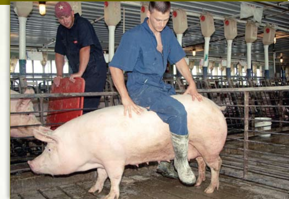
Incremente la presión del lomo o siéntese sobre la cerda para confirmar el reflejo de inmovilidad.