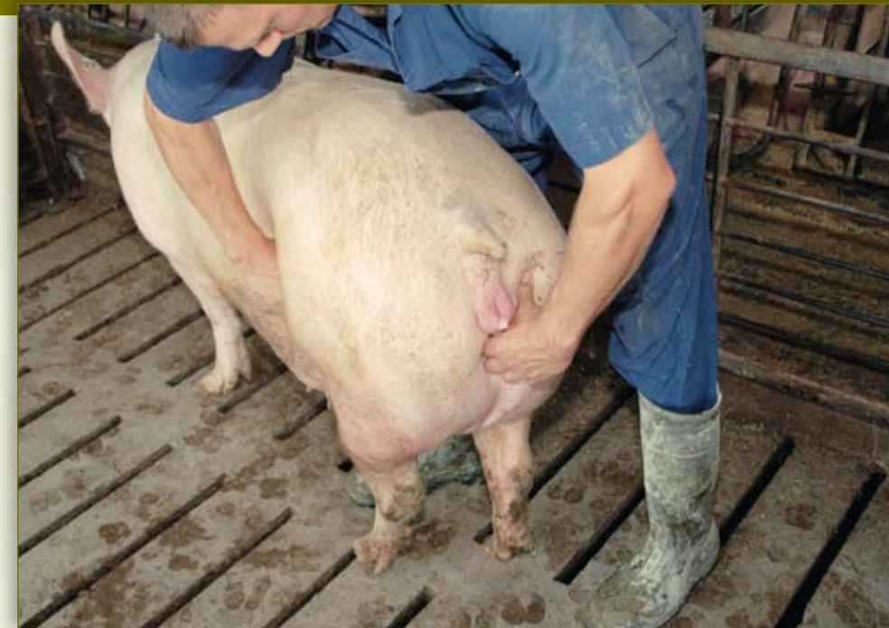
Presione el puño bajo la vulva, y use su dedo pulgar para determinar la presencia de secreciones pegajosas y viscosas en la vulva.