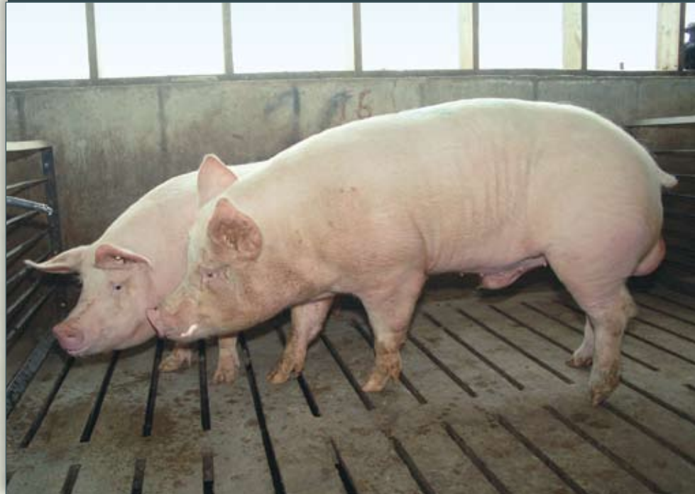
El semental trompea a la hembra y libera feromonas en su saliva, lo que estimula a la hembra en calor.