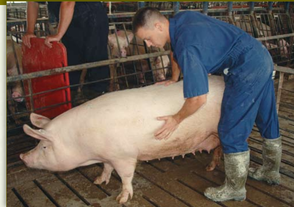
Frote los lados de la hembra y haga ligera presión en su lomo.