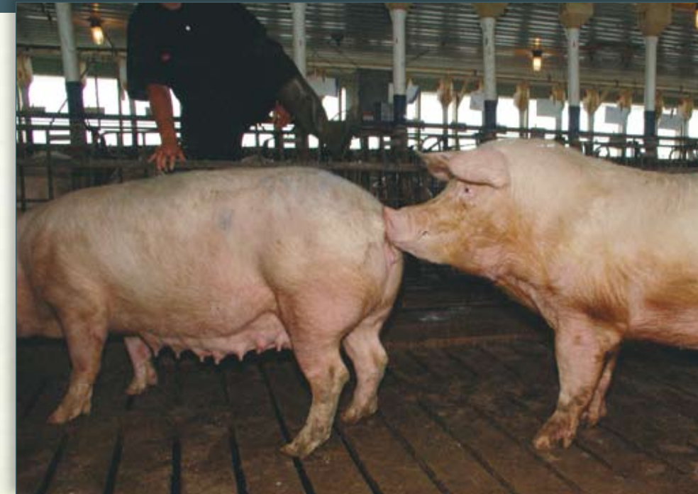
Mientras el semental trompea la vulva, este puede detectar la temperatura corporal elevada y las secreciones de la hembra en estro.