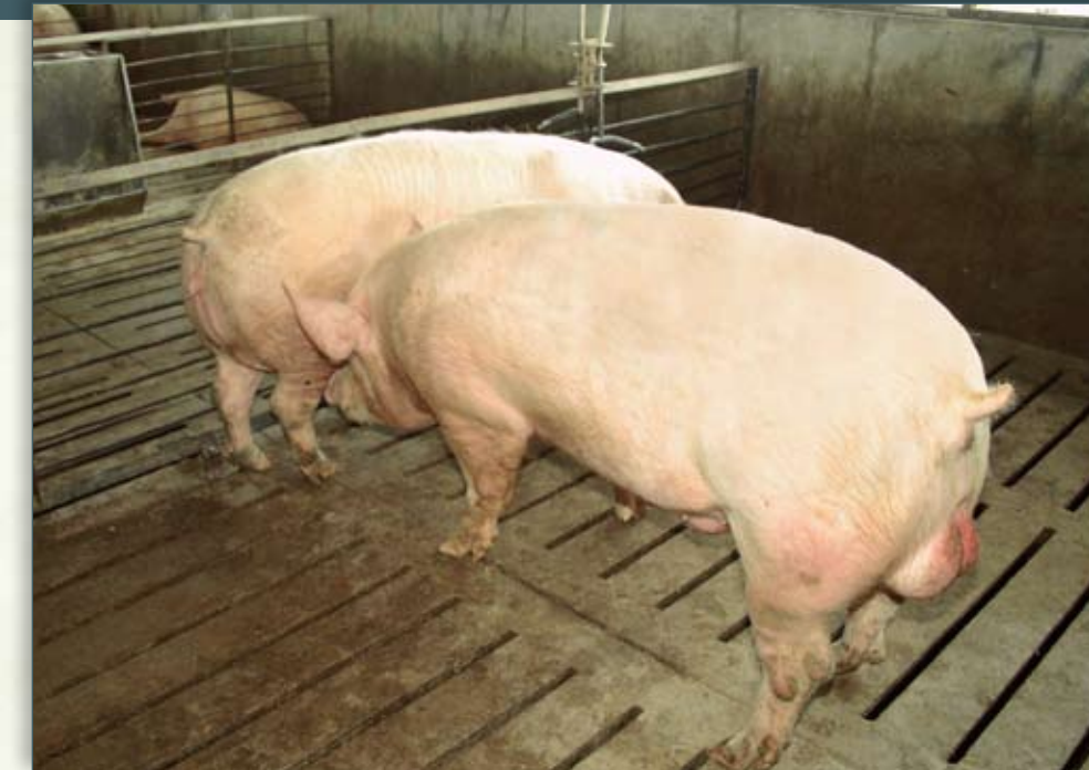
El semental empuja, trompea y levanta a la hembra, enfocándose en el área del flanco, buscando provocar una respuesta de inmovilidad rígida.