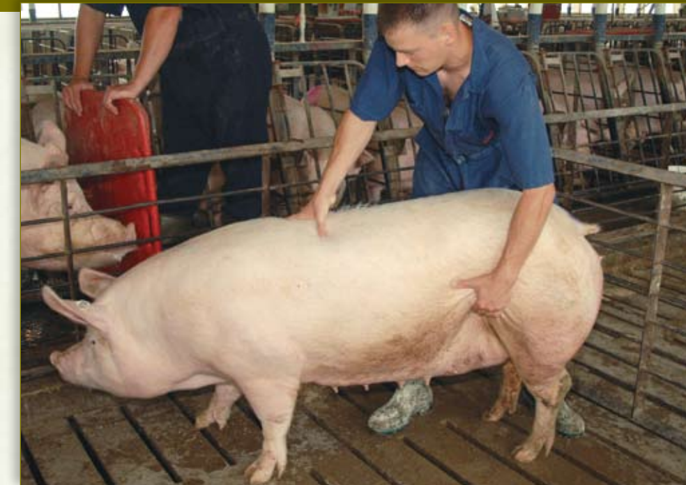
Jale o levante el flanco de la hembra y frote la ubre. Conforme se libere oxitocina, la hembra presentará el reflejo de inmovilidad.