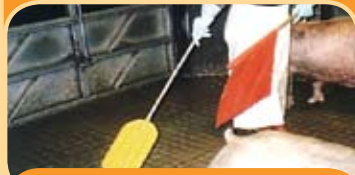
Bandera de plástico