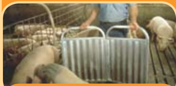
Capa de matador/bruja