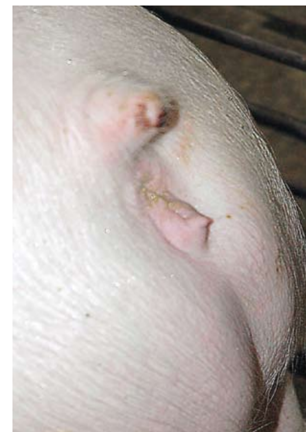
Esta vulva pequeña y ligeramente empinada hacia arriba puede crear problemas con la monta natural y a la hora del parto.