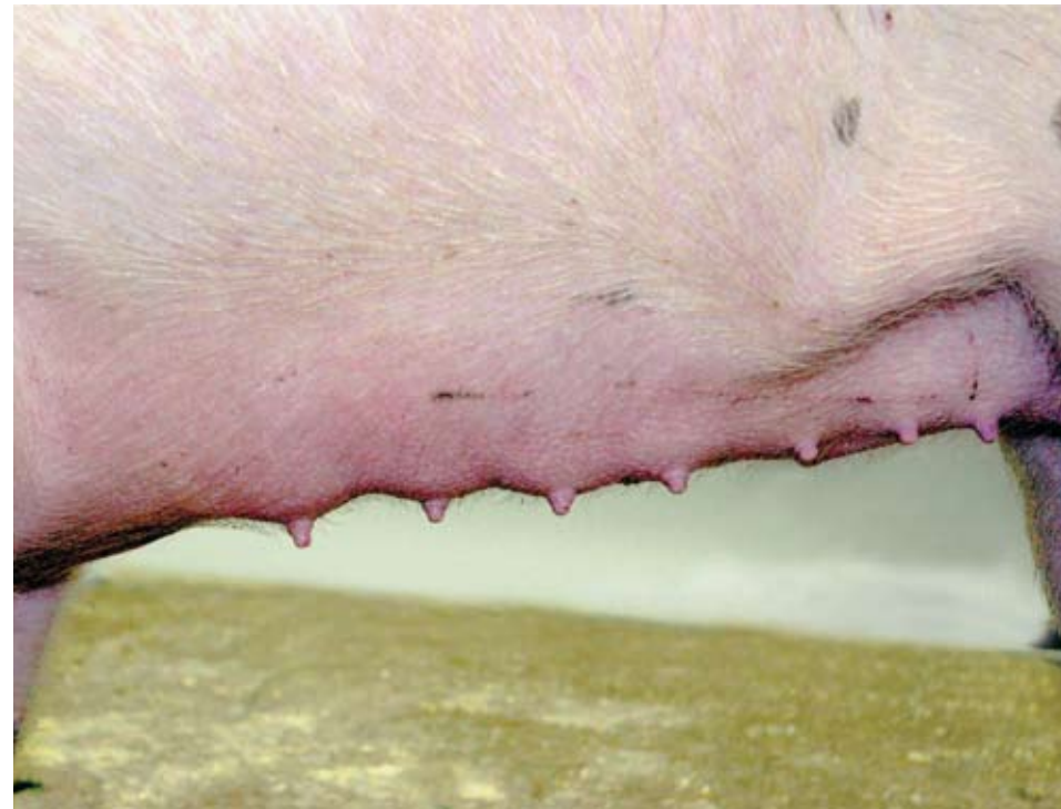
Una muy buena ubre con ocho tetas en cada lado, con buen espacio entre ellas. El tamaño y textura de estas tetas son excelentes.