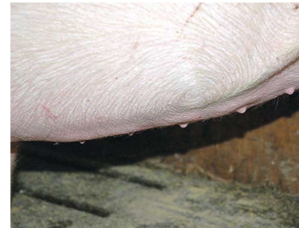
Esta hembra tiene seis tetas con buen espacio entre sí, sin embargo, su prominencia es pobre. Esta hembra debe de ser desechada.