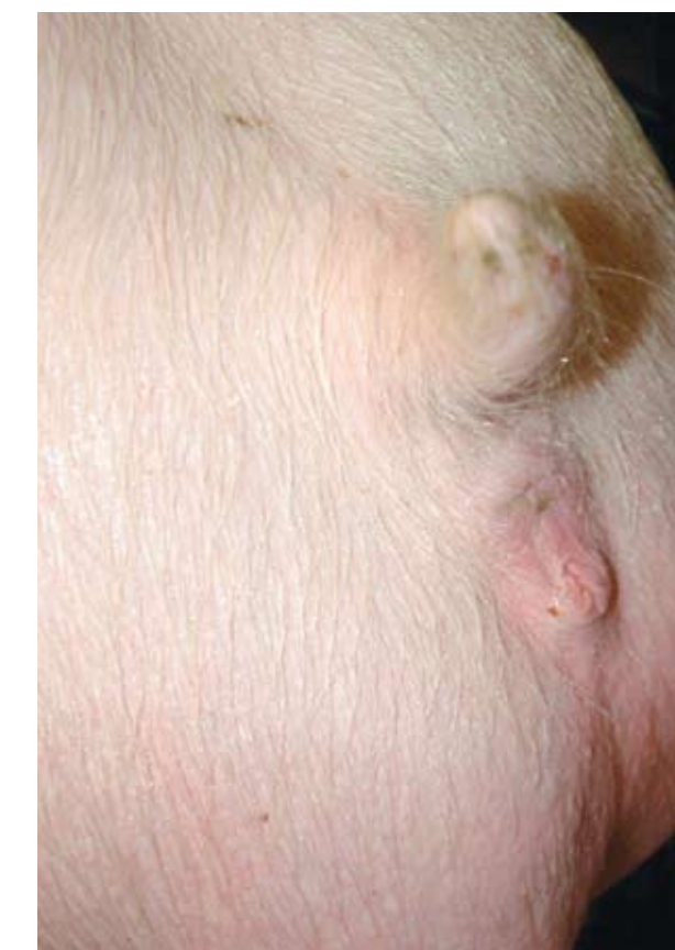
Esta vulva demasiado pequeña e infantil indica el subdesarrollo del tracto reproductivo. Esta hembra debe de ser desechada.