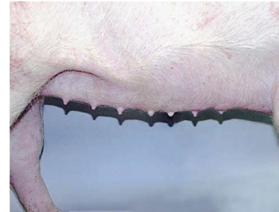
Buena ubre, sin embargo, el espacio entre la tercera teta y la cuarta no es adecuado para el desarrollo de la glándula mamaria.

Evaluando el tamaño y desarrollo de la vulva es otro paso crítico en la selección de hembras. Evite hembras con vulvas pequeñas, infantiles o que parecen estar empinadas hacia arriba. Ejemplos de vulvas aceptables e inaceptables se muestran en la parte inferior de este póster.