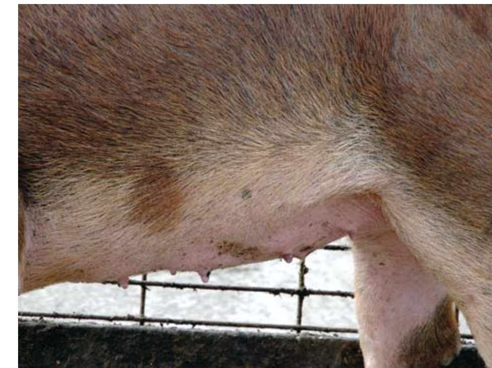
Esta hembra corta tiene solo cuatro tetas de cada lado. Ella debe de ser desechada.