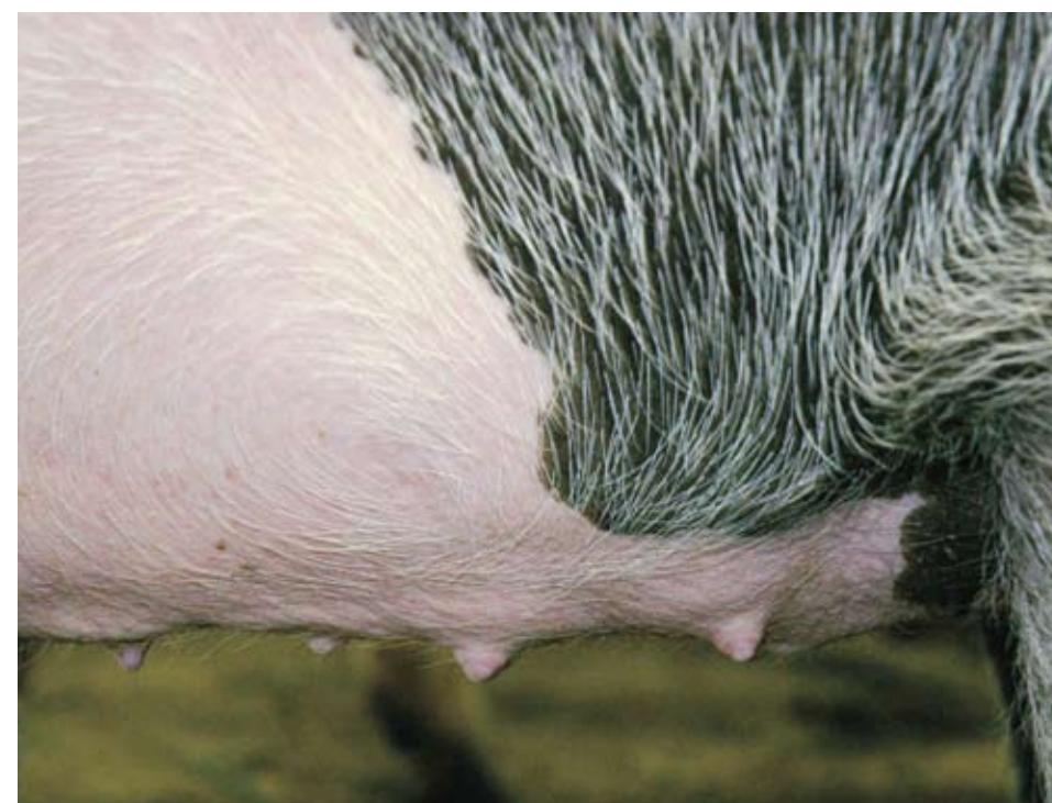
Esta hembra corta solo tiene cinco tetas y son ásperas. La segunda teta es de "cabeza del alfiler," y seguramente no será funcional. Esta hembra debe de ser desechada.