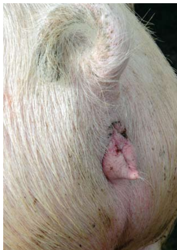
Esta hembra tiene una vulva bien desarrollada, con buen tamaño y forma.