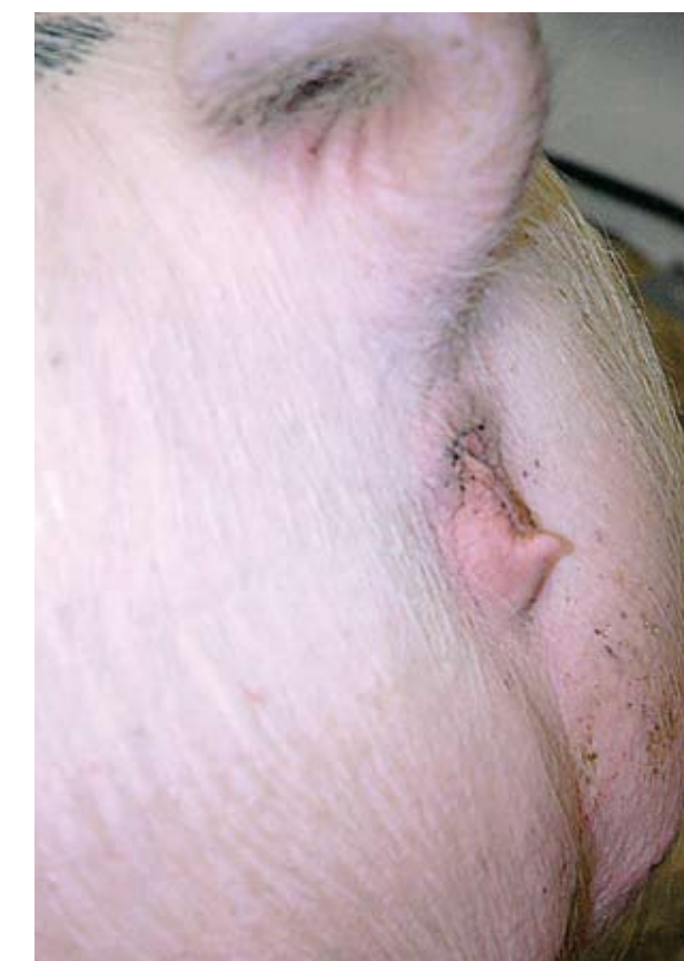
Esta vulva pequeña y empinada hacia arriba puede hacer más difícil la monta natural. Si la hembra se queda para el reemplazo de hato, asegúrese de que la característica no persista.