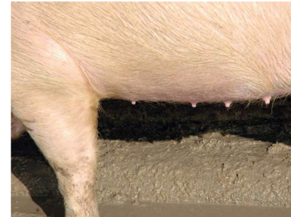
Espacio pobre entre la primera teta y la segunda, pero las otras tetas tienen buen espacio entre ellas y son de buena calidad.