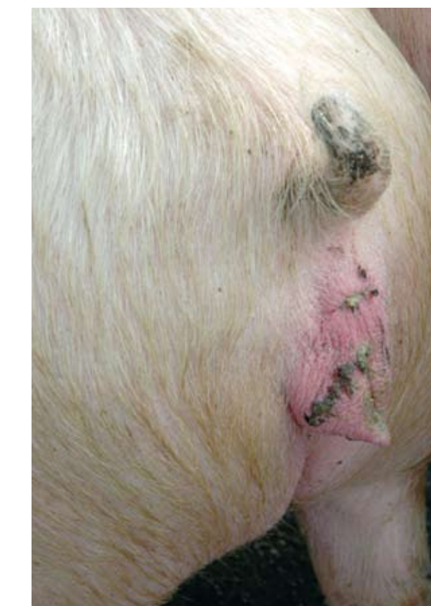
Las mordeduras u otras heridas a la vulva deben de ser revisadas cuidadosamente. Las heridas deben de sanar antes del servicio.