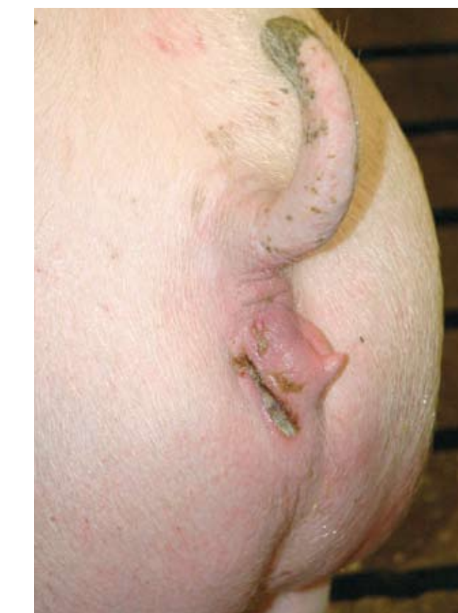
Las cicatrices en la vulva pueden crear problemas al parto. Revise las heridas cuidadosamente.