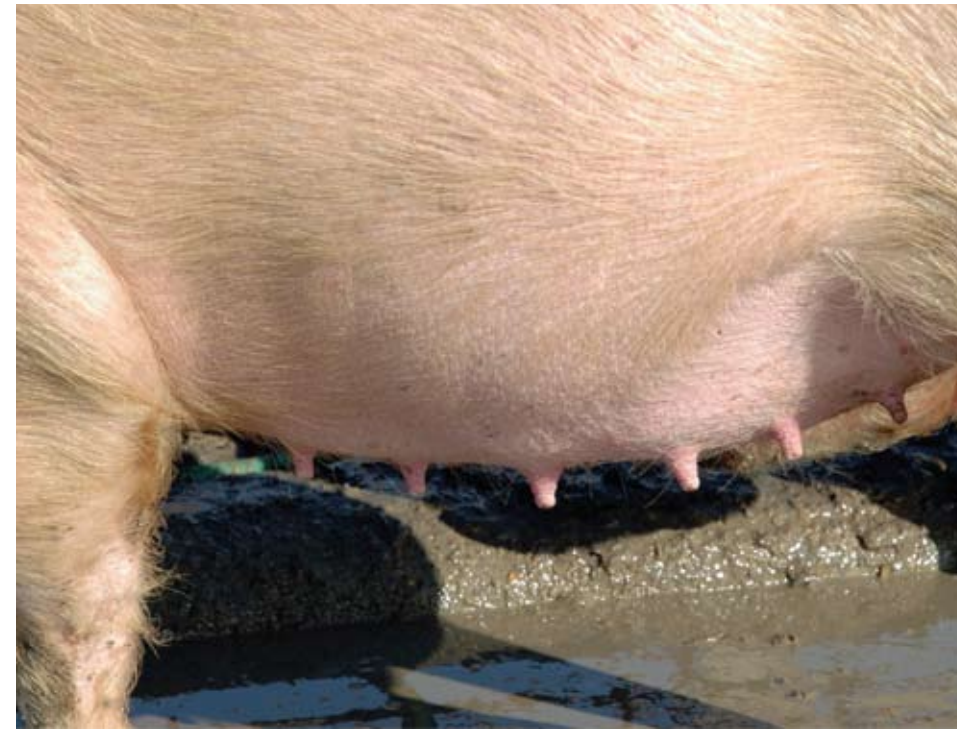
Note el desarrollo de las tetas en esta primeriza preñada. Las tetas tienen buen espacio entre sí, buen tamaño y textura.