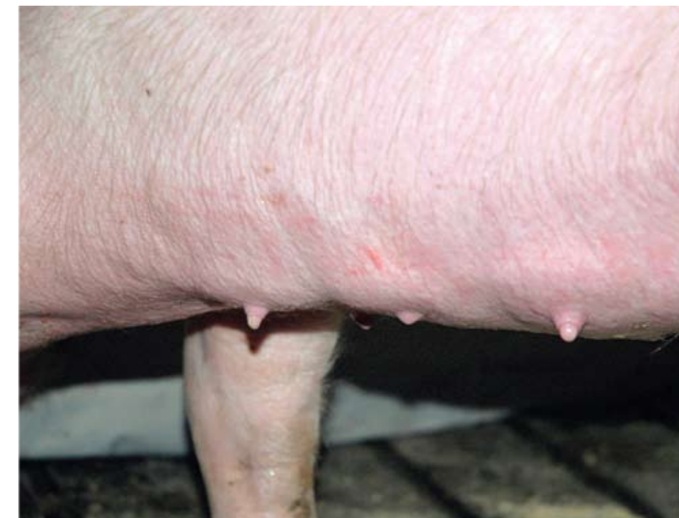
La segunda teta en la ubre de esta hembra es un ejemplo de teta no funcional y subdesarrollada.