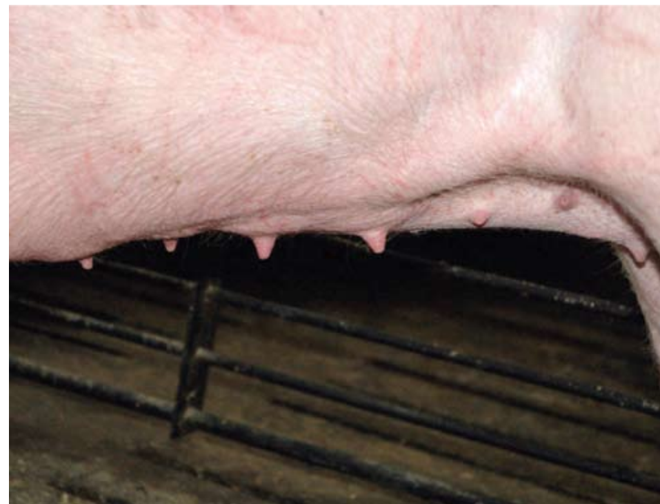
Esta ubre de pobre calidad muestra tetas de diferentes tamaños, con espacio no uniforme, mala posición y pobre calidad. Solo dos tetas parecen ser funcionales.